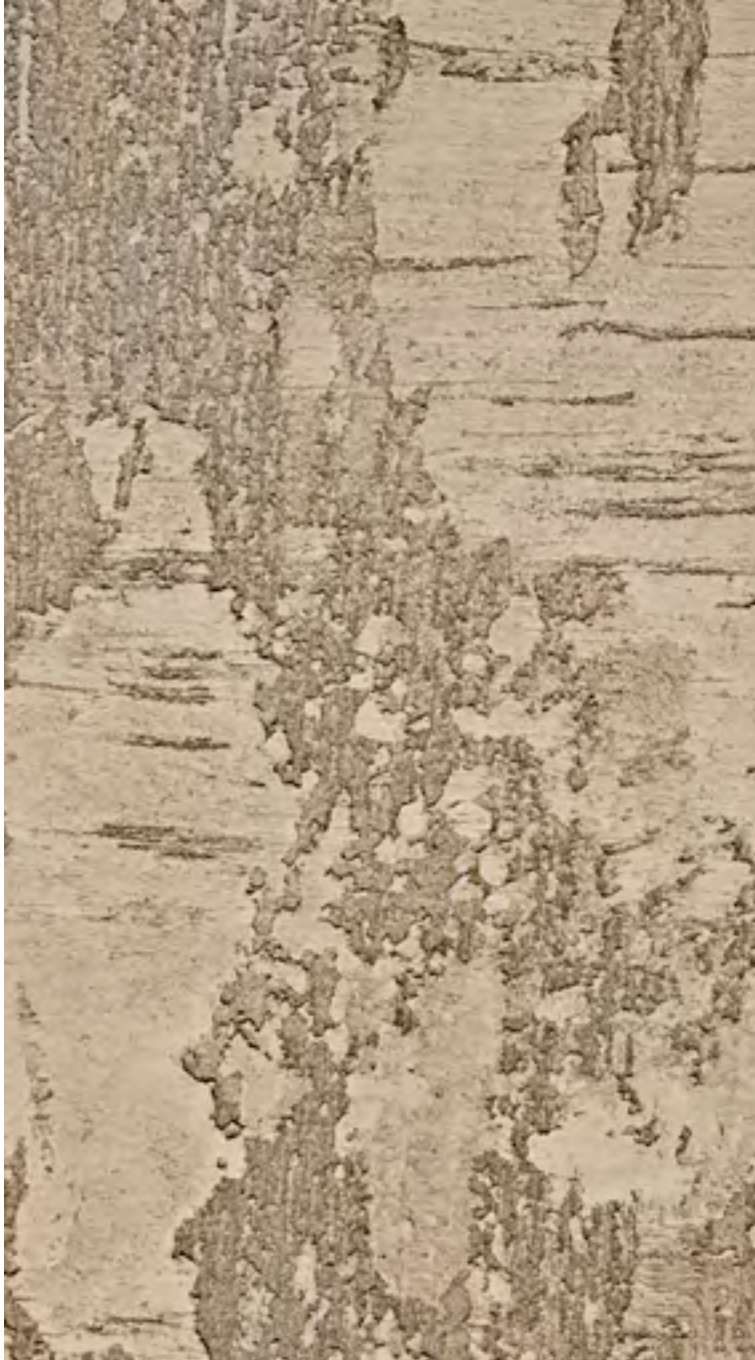
ARCHI+ CONCRETE BIANCO/WHITE & FASE SILOSSANICA 6101 (2 mani/layers)