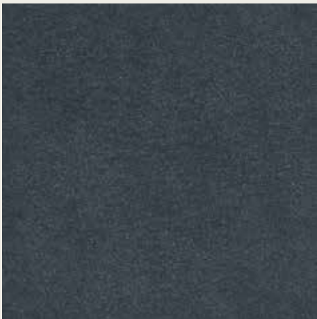
16072 ARGENTO OSSIDATO