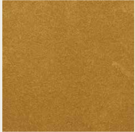
16071 ORO ROSSO